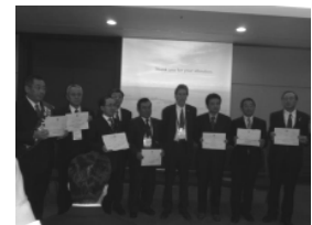
ラムサール条約事務局次長より、大崎市長、鶴岡市議会議員、阿賀野市長、久米島町長、近江八幡市副市長、安土町長、滋賀県自然環境保全課長に対し、授与された。